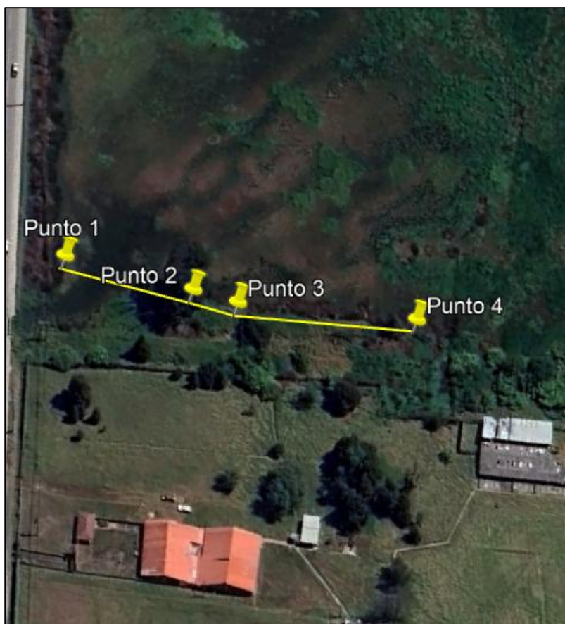
Ilustración 1. Recorrido

Con base en lo anterior, el día 26 de febrero de 2025 se realizó recorrido de control y vigilancia en el humedal Gualí desde las coordenadas 4°43'34,866" N-74°11'29,91" W hasta las coordenadas 4°43'31,422"N-74°11'26,544"W (ver ilustración 1. Ruta amarilla) vereda Hato, ecosistema que fue declarado por la Corporación Autónoma Regional de Cundinamarca - CAR como Distrito Regional de Manejo Integrado a través el acuerdo 001 de 2014 "Por medio del cual se declaran como Distrito Regional de Manejo Integrado (DMI), los terrenos comprendidos por los humedales de Gualí, Tres Esquinas y Lagunas de Funzhé, y su área de influencia directa ubicada en los municipios de Funza, Mosquera y Tenjo, Cundinamarca", y estableció tres zonas: 1. Preservación (espejo de agua), 2. Recuperación (50 metros) y 3. Uso sostenible (100 metros).